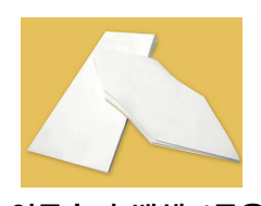
연등속지 백색 1묶음