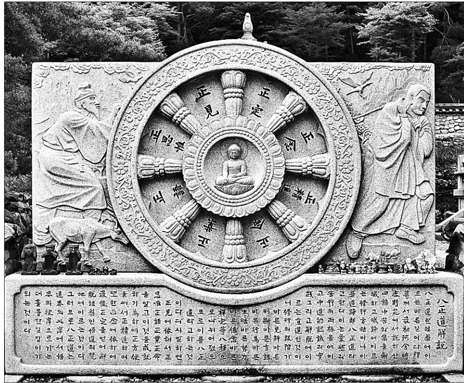
구미 도리사의 팔정도 해설비. 부처님의 근본 가르침이자 실천 지침인 팔정도를 행할 수 있게 하는 원동력은 중도의 마음을 가지는 것이다.

'전도'라는 것은 그 판단사색(判斷思擇)에 있어서 순서에 맞지 않으며 진상을 잘못