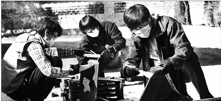
불교문화재연구소가 2014년 진행한 목판 일제조사사업 모습

목판 일제조사의 2년차 사업을 맞아 경판 인출을 시행한다. 인출되는 경판은 2014년 조사완료된 송광사를 비롯한 호남지역의 경판 21종으로 인출 자료는 국가지정문화재 지정을 위한 기초자료로 활용된다. 또 2015년에는 부산과 울산, 경남 지역 7개 사찰의 목판 5481점이 조사되며 범어사