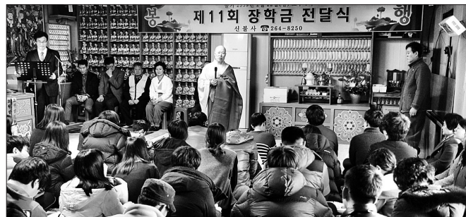
(사)한국불교금강선원 울산 신불사와 초록우산 어린이재단 울산지역본부는 2월 22일 신불사에서 저소득 가정 학생을 지원하기 위한 제 11회 장학금 전달식을 가졌다. 이 자리에서는 초중고생 31명에게 총 3720만원의 장학금이 전달됐다.

신불사는 자비회를 주축으로 화원들이 모은 성금을 매년 지역 내 어려운 환경속에서도 학업에 열중한 학생들을 선발, 1년동안 매월 10만원씩 장학금을 정기적으로 지원하고 있다. 장학사업을 주도적으로 펼치는 신불사 자비회는 2004년 4명으로 발족했으며, 10년이 지난 현재 3백여명의 회원이 활동하고 있다.