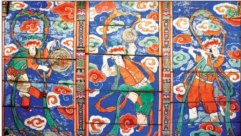
빛반자 천정에 배운 주악비천벽화.

이러한 형식의 천정은 통도사 해장보각 천정에서나 드물게 찾아볼 수 있다. 명멸해가는 불건왕조의 퇴락 속에서 불교부흥의 유일한 활로로서 대중 속으로 들어가기 위해 대중의 기복욕구를 포용할 수밖에 없었던 것은 어쩌면 시대적 숙명이었을 것이다. 시대의 개방적 흐름과 함께 대중 속으로 '아제 아제 바라아제'를 합송하며 낮은 곳으로 흐르는 한국불교의 도도한 흐름을 장엄의 편린 속에서도 읽을 수 있는 것이다.