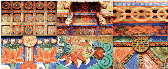
팔상전 단집에 배운 팔보문양과 평면 우물천정의 삼태극연화문, 그리고 대들보 머리조로 입힌 드문 사례의 불수감 머리조다. 나머지는 감실천정의 세부다.