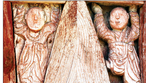
독성전 출입구에 새긴 남녀인물상. 우주법계를 떠받치고 있는力士다.