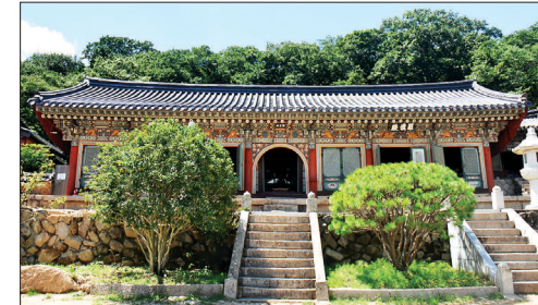
팔상독성나한전 전경. 한 건축에 세 불전을 경영한 독특한 건축이다.