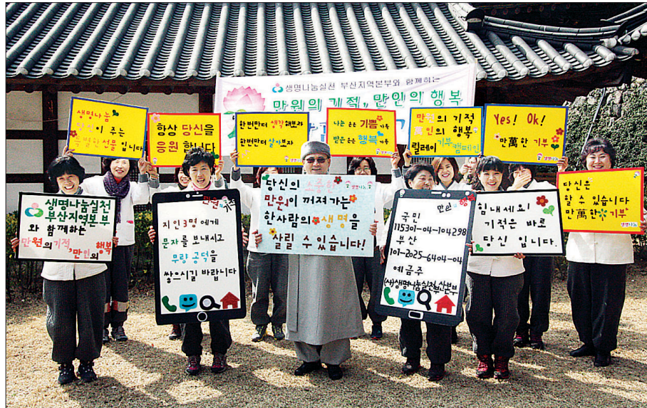
생명나눔실천 부산본부는 2월 26일 부산 선암사에서 기부 릴레이 캠페인 ‘만원의 기적, 만인의 행복 만만하 기부’ 발대식을 개최했다. 선암사 신도들이 기부를 위한 구호 피켓을 들고 함께 동참하 기를 권유하며 환하게 웃었다.

부산생명나눔실천은 이번 릴레이 기부를 통해 10만명의 동참을 이끌어내고 한 사람당 한 구와 만원 기부로 총 10억을 목표로 두고 있다. 이 후원금으로 생명나눔실천은 난치병 환우 돕기, 기부문화 확산, 자살예방센터 활성화에 적극 지원한다는 계획이다. 특히 부산생명나눔은 “경제적으로 어려운 환우들이 너무나 많지만 현재는 사