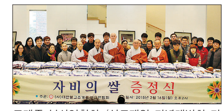
조계종 부산연합회 ‘성도재일 기념대법회 기념 자비의 쌀 증정식’

이날 전달식에는 1000만원 상당의 자비의 쌀이 개교종합사회복지관 외 30여 개의 무료급식소 및 자원봉사단체에 기부됐다. 자비의 쌀은 지난 1월 25일 제4회 조계종 부산연합회 성도재일 기념대법회 행사에서 모은 불우이웃돕기 성금으로 마련됐다. 회장 수진 스님은 “해마다 쌀을 나눠 드