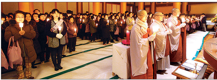
정초를 맞아 부산 한마음선원은 2월 22일~24일간 촛불재를 봉행했다.