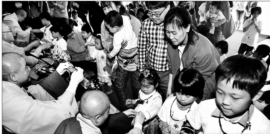
2014년 광주봉축행사 우수 사업으로 선정된 어린이 수계산림 모습.

이번에 확정된 공모사업의 가장 중요한 특징은 어린이·청소년 프로그램이다. 주목받는 프로그램은 ‘빛고을 골목길 탐방 다큐멘터리 제작’이다. 선택사 대안도서관에서 응모한 이 프로그램은 청소년들이 부처님오신날을 맞아 저마다 비디오키메라를 들고 사찰을 다니며 촬영한 영상을 다큐멘터리로 제작하는 내용을 담고 있다. 교사 1명의 지도하에 청소년 4인으로 총 5개조를 구성해 사전 조사활동과 불교문화재 촬영, 사찰 스님 인터뷰 등을 진행한다. 이어 사찰엽서, DVD제작, 홍보부스 운영 등의 사업도 병행한다.