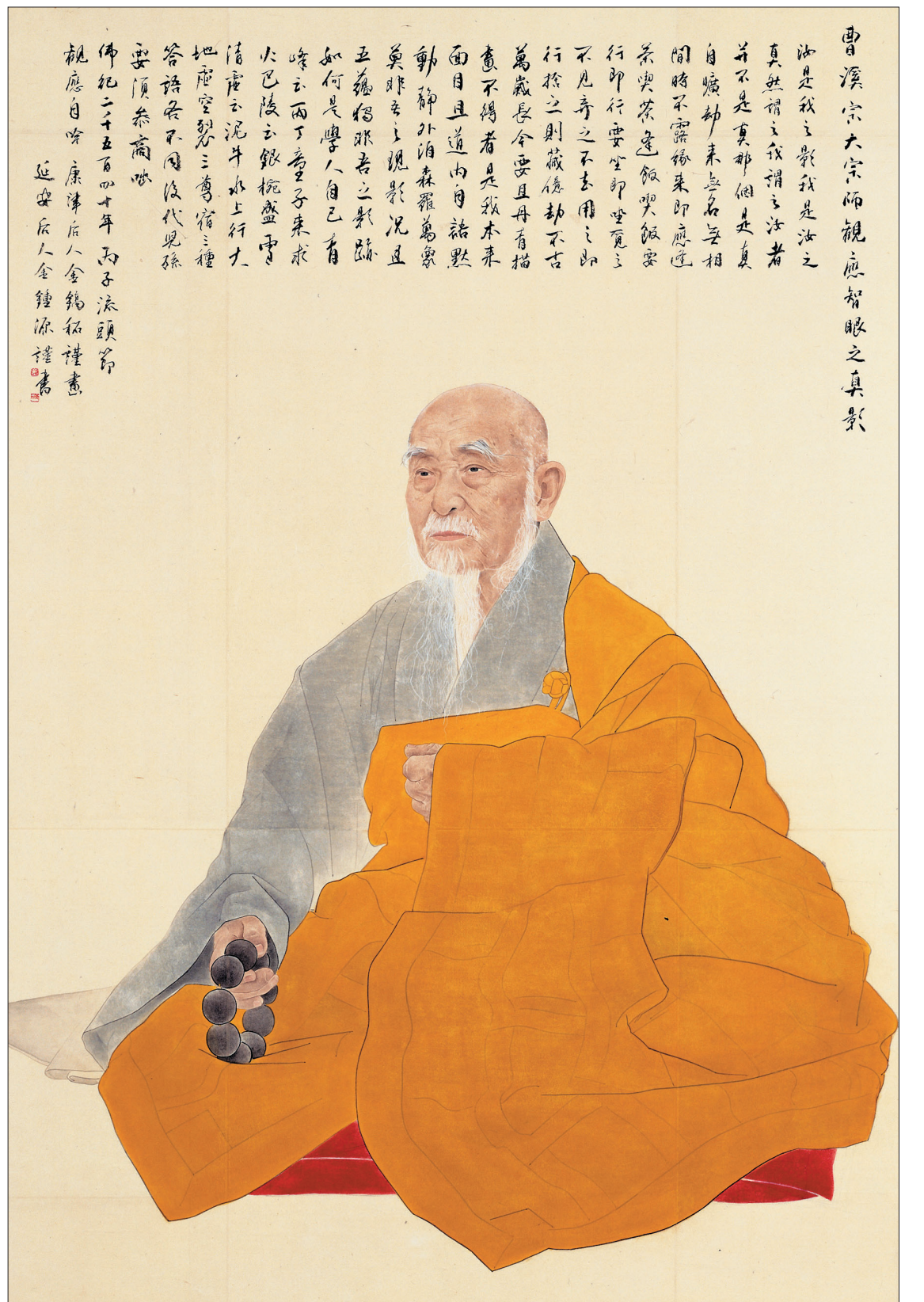
관음스님, 174X114cm, 종이에 수묵채색, 1995년, 작가소장. 진영 작업은 그려 나가는 과정 하나하나가 곧 그림이다. 화가 자신이 존경하는 마음으로 완성한 그림만이 다른 예배자의 마음을 움직일 수 있다고 생각한다.

관음 스님 진영 작업을 할 때는 이 모든 조건이 충족됐다. 거짓말처럼 어느 것 하나 막힘없이 순조롭게 풀렸다.