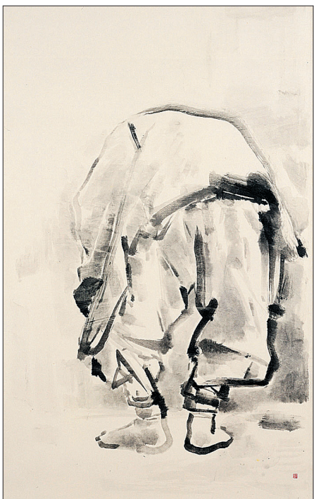
선-산빛이 가늘게 어깨를 눌렀다. 191X97cm, 종이에 수묵, 1997년, 작가소장. 작업은 무엇보다 대상자에 대한 접근이 자유로워야 한다. 대상에 대한 관찰의 힘도 중요하지만 특징이 잘 드러날 수 있도록 대상자만의 특정 요소를 포착하는 것은 화가의 몫이다.