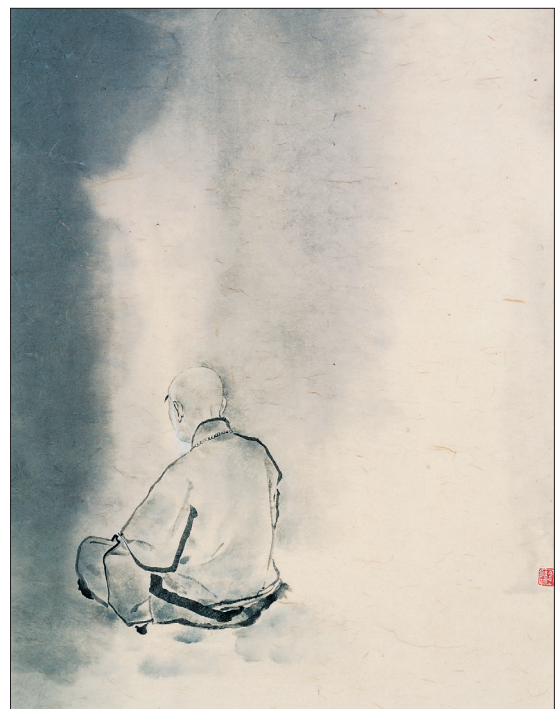
묵선, 60.5X51cm, 종이에 수묵, 1995년, 적지사 중앙미술장. 정성과 진심을 다했다. 그 덕분에 미술 사학자와 미술평론가로부터 관음 스님 그림이 내 그림 중 최고 득의작(得意作)이라는 평가를 받았다. 나는 이 작품을 보내는 게 못내 아쉬웠지만, 사람들이 좋은 작품을 통해 그분을 기리는 것이 더욱 의미 있는 일이라 판단해 사육을 버리기로 했다.