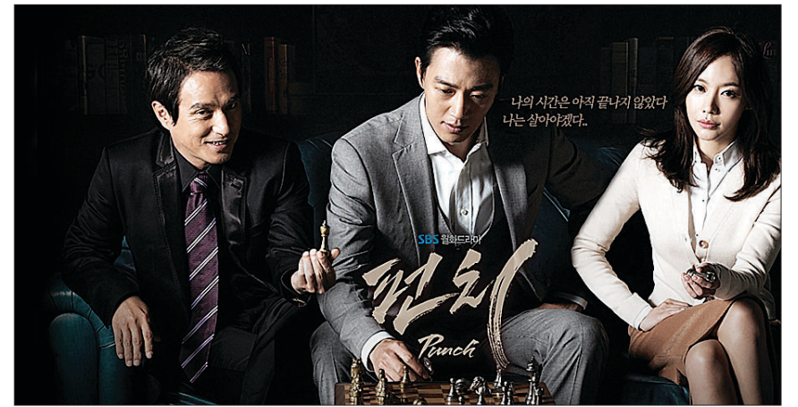
드라마 편지는 권력의 달콤함과 허망함을 통해 인간의 욕망을 돌아보게 한다.

하지만 시간이 지날수록 선인도 악인도 없다. 모든 경계가 무너져버린다. 윤지숙과 이태준은 권력을 지키기 위해 혹은 더 높이 올라가기 위해 치고 박고 싸우는 적이 되고 때로는 모종의 거래를 통해 아군이 된다. 한 순간의 권력을 누리기 위해 속삭이게 쫓고 쫓기며 역전에 역전이 거듭된다.