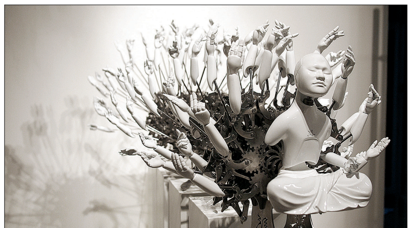
천수천안 관음을 작품으로 탄생시켰다. 이 작품에는 중생을 보살피는 자비의 마음이 실려 있다.