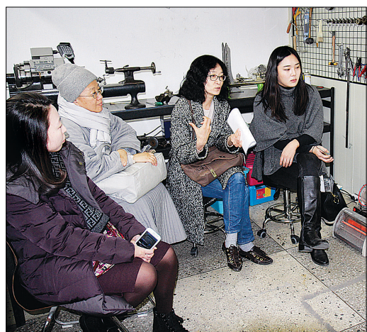
붓다아트페스티벌 측이 주최한 작가와 평론가와의 만남. 왕 작가의 문래동 작업실에서 이루어졌다.