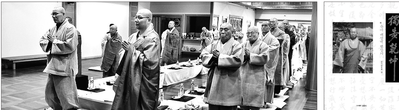
2월 7일 선운사에서 열린 윤기 스님 24주기 추모제에서 스님들이 윤기 스님의 가르침 잇기를 서원하고 있다. 사진 오른쪽은 행장집.