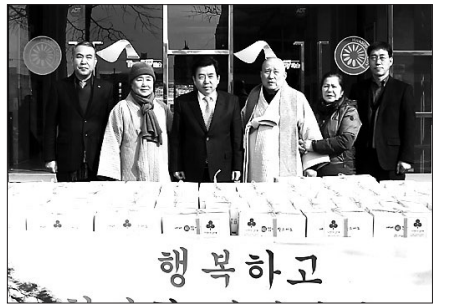
한편 진각국사 선양회는 매년 어려운 이웃을 위한 나눔물품을 전달하고 있다.