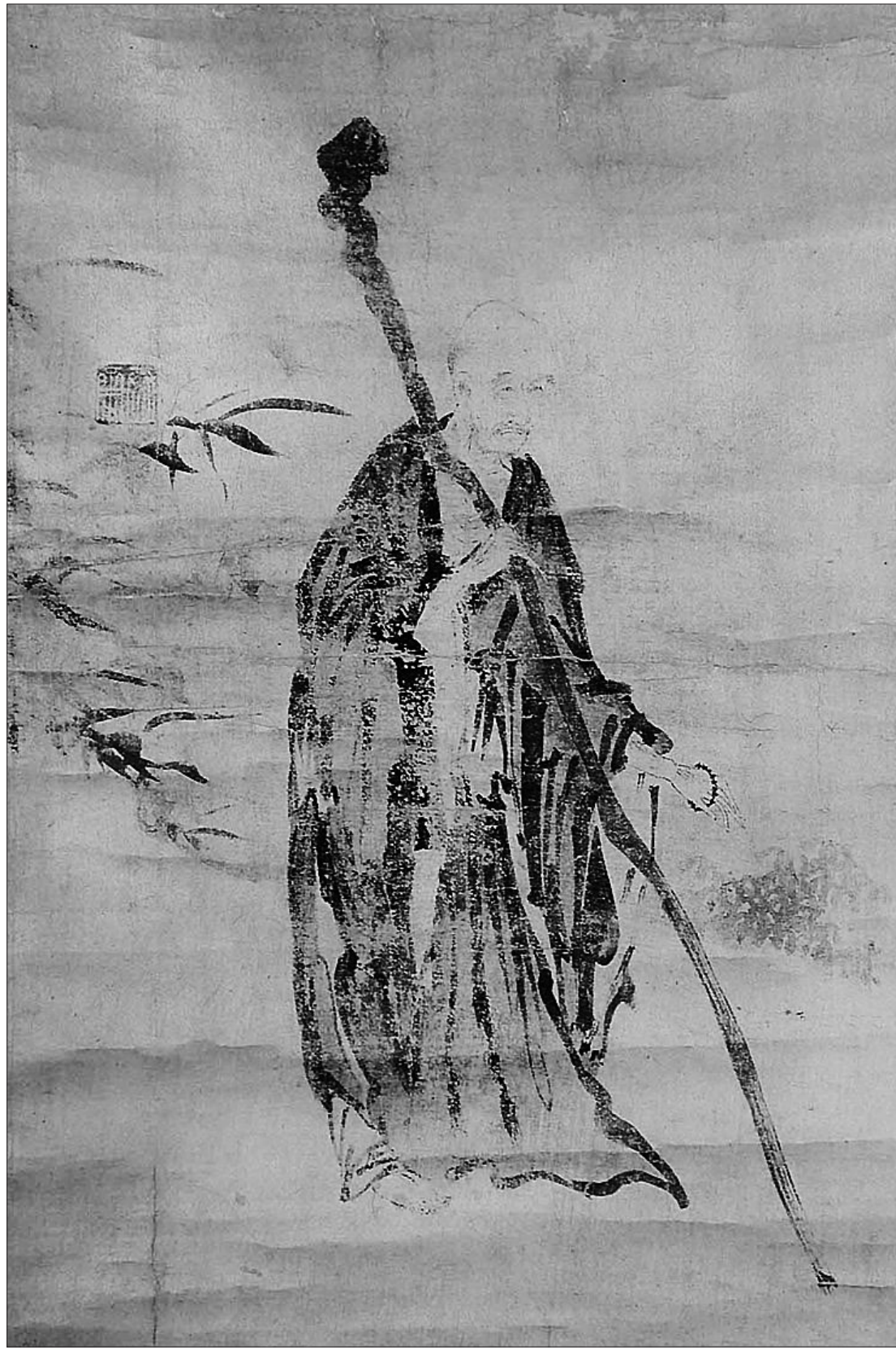
조선 화가 윤두서가 그린 '노승도(老僧圖)'. 옛날 중국과 한반도에 시를 짓는 능력은 곧 수준 높은 대화에 참여할 수 있음을 보여주는 척도였다. 당송 시대 시구를 모은 <백가의집>에는 시승의 시들도 대거 실려 있다. 스님들 역시 시를 통해 자신의 감정과 깨달음을 오래 전부터 노래하고 있음을 알 수 있다.

<백가의집>은 세속의 시는 물론이고 당과 송의 불교시를 연구하는 새로운 금광과 같다. <백가의집>을