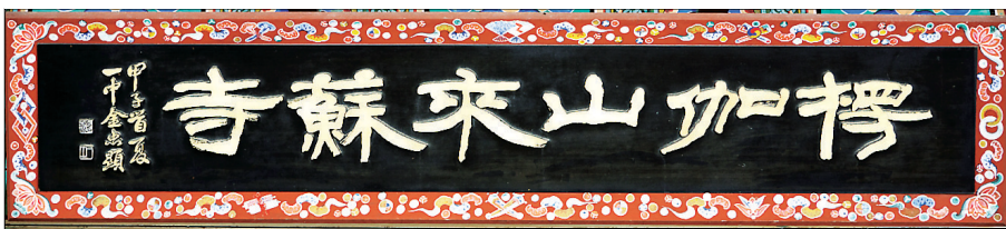
한국 서예의 대가 김충현의 현판 글씨를 만날 수 있는 전시가 관훈동 백악미술관서 열린다. 사진은 내소사 일주문 편액