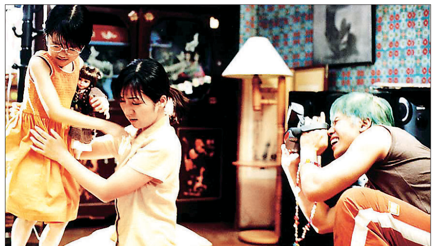
복수에 복수를 거듭하며 팽팽한 긴장감을 일으키는 영화 ‘복수는 나의 것’은 가족 혹은 사랑하는 이의 죽음을 있는 그대로 받아들이지 못하는 인간의 집착이 빚어낸 복잡다단한 이야기를 펼친다.

“아들을 잃은 여인”을 교화시킨 부처님의 이야기는 사랑하는 이의 죽음을 어떻게 받아들이야 하는지 일깨워준다. 한 여인이 죽은 아들을 안고 부처님께 찾아와 “아들을 살릴 약을 달라”고 애원한다. 부처님은 여인에게 마을로 내려가 “한 번도 죽은 사람이 없는 집을 찾아서 겨우 세 몇 개를 얻어오면 아들을 살릴 약을