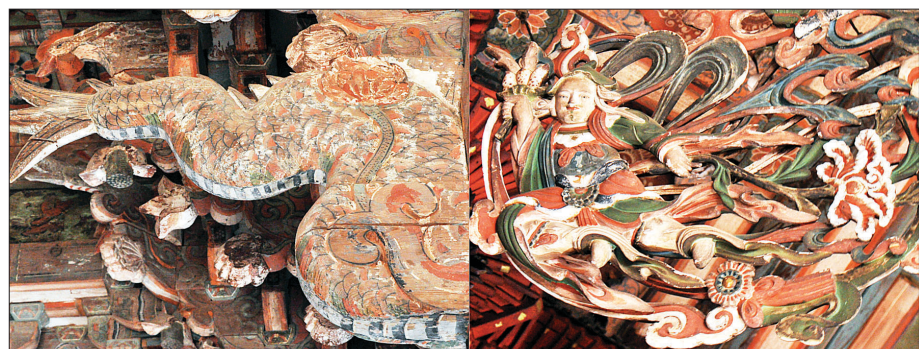
어간 주심기둥의 용미장식(사진 왼쪽)과 달집의 비천상

대웅보전은 내4출목을 갖추었다. 사찰건축의 공포구조는 가구식 역학구조이기도 하지만, 본질적인 체(體)는 건축에 흐르는 신령한 기운의 조형적 상징체계라 할 것이다. 내4출목의 첨차와 살미장치는 성리학적 석주물 연상케 하는 돌기둥, 대방(大房) 등 궁궐이나 관가적 건축요소가 곳곳에 남아있으며, 유교적 제사공간인 재각(齋閣: 호성전)과 부모모중경관을 보장하고 있어 용주사 고유의 독특함을 드러낸다.