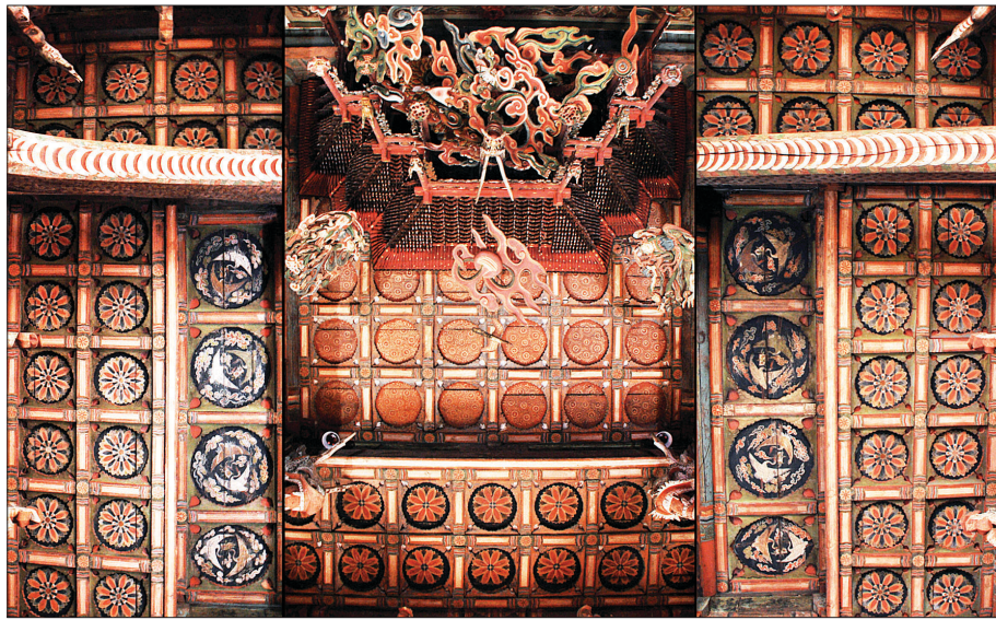
대웅보전 어간과 좌우협칸 천정에 장엄된 전체문양.