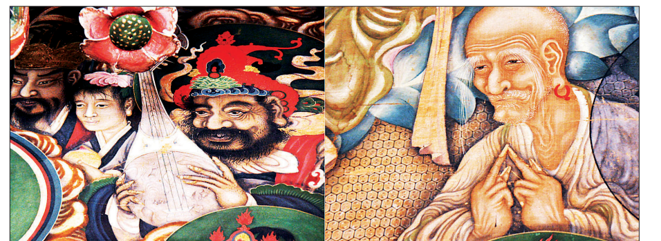
명암법이 적용된 대웅보전 후불탱의 세부 모습