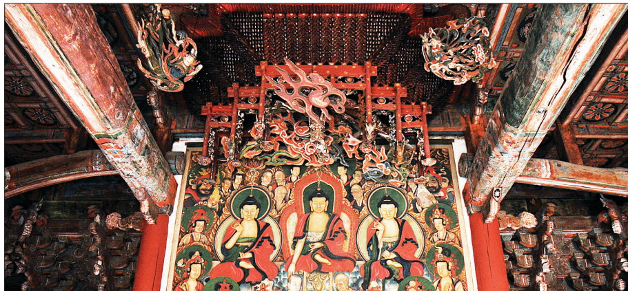
대웅보전에 모신 삼세불과 후불탱, 그리고 달집

나가는 생명력의 굽은 꽃가지다. 용 몸통 따라 뻗어나가는 넝쿨 갈래에서 붉은 연꽃 한 송이가 미어터지고 있다. 용과 꽃의 형상이 서로 닮았는데, 서로의 기운을 더욱 고양시키는 형세다. 용과 연꽃의 형상은 자연의 물상 소묘의 단계를 넘어 공간에 흐르는 내면적이며 우주적인 에너지를 표출하는 이형사신(以形寫神)에 다름 아니다. 형상의 상을 통해 정신의 체를 드러내는 사의적인 상징체계인 것이다.