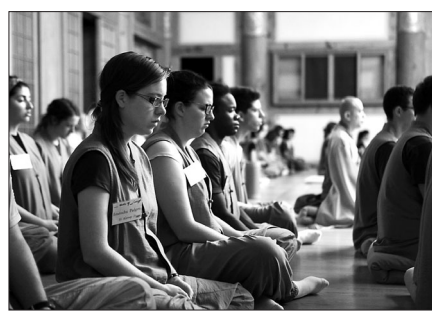
템플스테이에 참여하고 있는 외국인유학생들

조계종 한국문화연수원(연수원장 구과)과 한국불교문화사업단(단장 진화)은 2월 8일까지 매주 금·일요일 외국인유학생과 한국인친구가 함께하는 템플스테이를 진행한다. 지난해 12월부터 매주 진행된 외국인 유학생템플스테이는 한국문화연수원에서 템플스테이 소개, 친교의 시간 및 전통놀이, 숲명상 등의 프로그램으로 진행되고, 일요일까지 마곡사, 법주사, 수덕사 등에서 1박 2일간 사찰문화를 체험하는 일정으로 구성된다. 참가비는 무료로, 템플스테이 홈페이지(www.templestay.com) 이벤트 페이지에서 신청할 수 있으며 대상은 외국인유학생이나 외국인 유학생을 동반한 한국인 친구여야 한다.