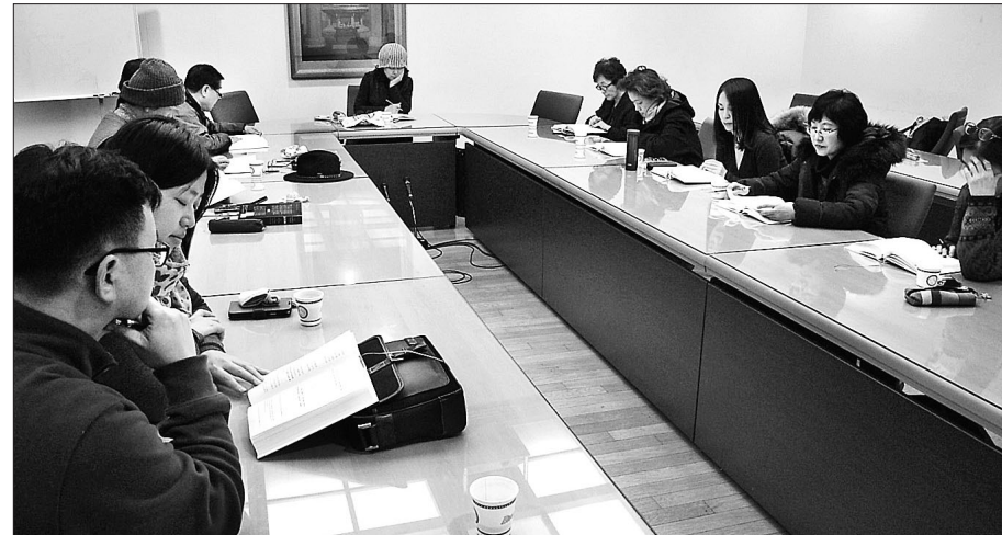
불교 독서모임 가운데 가장 대표적인 모임인 '붓다와 떠나는 책 여행'. 이 모임은 매주 수요일 오후 7시 30분 한국불교역사문화기념관 2층 회의실에서 책을 강독하는 형식으로 진행되고 있다.