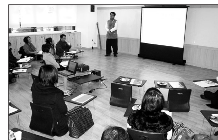
지하철 풍경소리는 지난 해 12월 3일 풍경소리 학교에서 '청소년 명상보급을 위한 청소년 정신건강 실태조사' 보고회를 열고 1월 30일 명상나눔 협동조합을 창립했다.

프로그램은 ‘풍경소리 학교’를 통해 교육이 진행됐고, 좋은 평가를 얻은 ‘몸담긴강교실’을 기본으로 구성될 예정이다. ‘몸담긴강교실’은 균형 잡힌 몸과 안정된 마음의 상호작용에 대한 이해를 근간으로 하는 프로그램으로 명상교육을 통한 심리적 안정감 증진과 더불어 고정, 요가 등을 교육하여 올바른 신체균형을 유지할 수 있도록 유도하고 있다.