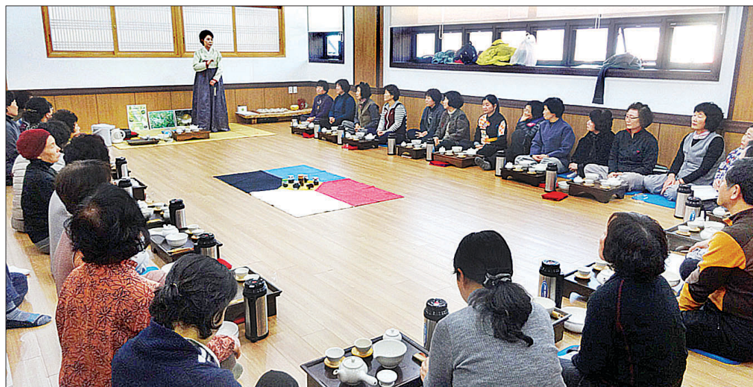
선차 명상 수업. '내 마음의 차'를 주제로 진행된 수업에서는 차 명상이 정서적 안정을 가져올 수 있음을 배운다.