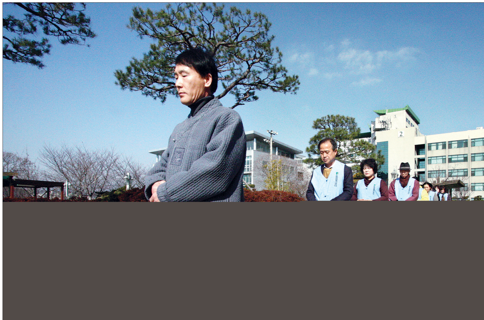
'청소년 창의 인성교육을 위한 명상지도자연수'에 참가한 130여 교사들은 명상을 통해 교육의 새바람을 일으켜 보겠다는 취지로 1월 23~25일 부산 동명대 세계선센터에서 명상교육을 가졌다. 사진은 참가교사들이 행선을 하는 모습