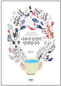
나보다 당신이 먼저입니다 주경 지음 마음의 숲 펴냄 1만 3천원

“양보와 배려 마음 별도 과묵으로 만들어야 느리게 걷자... 걸음 빠르면 마음도 바빠져 화나면 ‘육’ 하는 것까진 좋지만 ‘딱’ 말자 가정 위기 겪는 50대 남성, 밥부터 해보자”