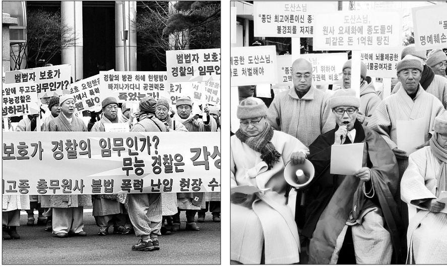
태고종 총무원장이 비상대책위의 23일 총무원사 점거로 촉발됐다. 태고종 집행부의 26일 경찰청 항의시위(사진 왼쪽)와 비대위측의 28일 기자회견 모습