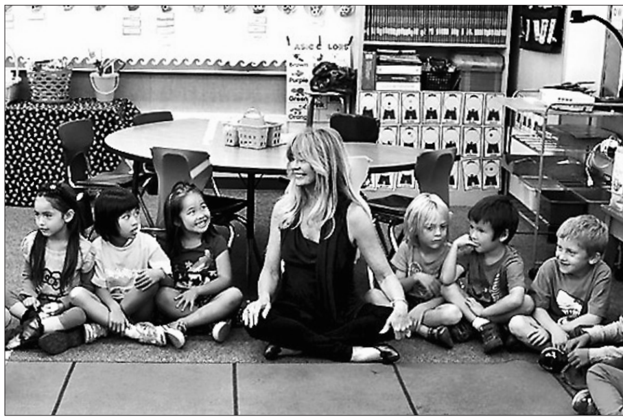
‘MindUP’ 코스는, 할리우드 스타 골드 혼(Goldie Hawn, 사진 가운데)이 불교의 명상수행을 기초로 삼아 만든 감성교육 프로그램의 일종이다.