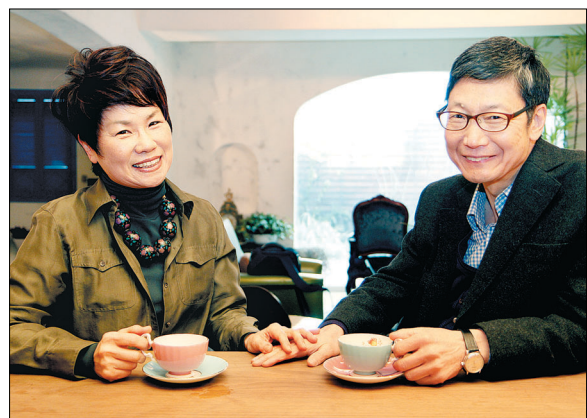
부부는 서로의 도반으로서 한길을 같이 가는 든든한 동반자이자, 애인이며, 때로는 선생님이자 친구이다.