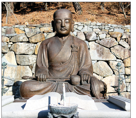
도리사 창건주인 아도화상 동상