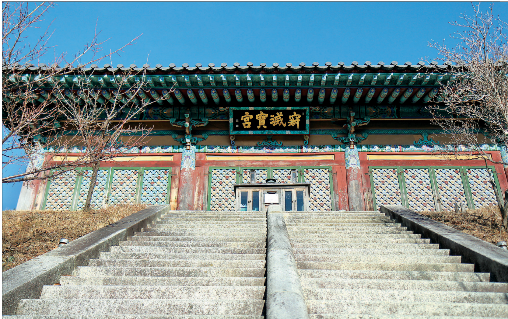
1977년 4월 세존사리탑 해체복원과정에서 석가모니 사리1과가 발견됐다. 이 사리를 모시기 위해 지어진 적멸보궁이 도리사 제일 높은 곳에서 위용을 자랑한다.

신라 불교 초전법륜지이지만 조선시대에 들어서는 쇠락의 길을 걷는다. 숙종 3년(AD 1677)에 큰 불이 나서 절이 모두 불타고 아도화상이 좌선했던 산