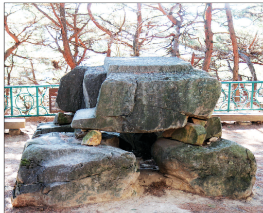
아도화상이 참선했다는 좌선대