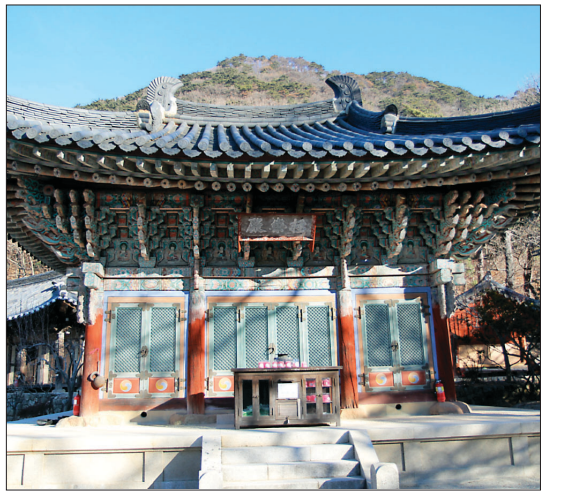
옛 금당암 법당으로 추정되는 극락전