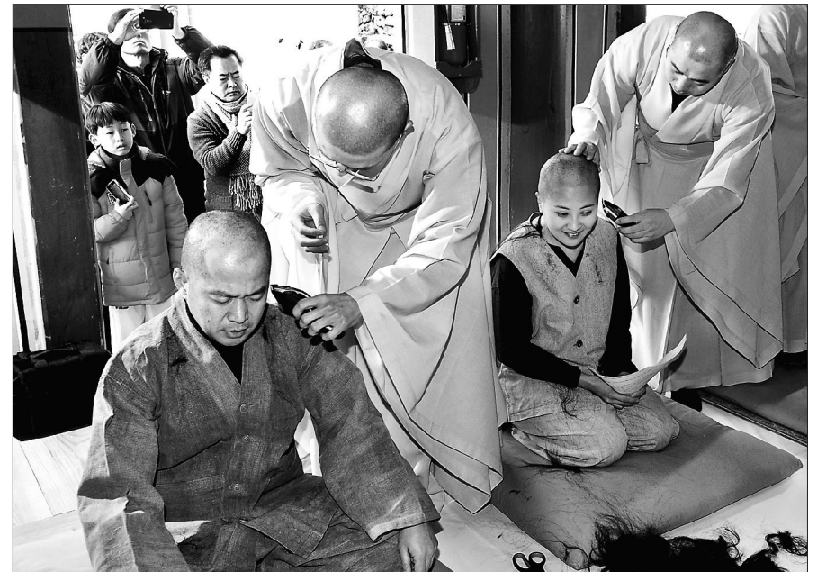
하심으로 부처님 법 표현해요 광주에서 펼쳐질 불교 연극 ‘그것은 목탁구멍 속의 작은 어둠이었습니다’의 출연 배우들이 삭발의식을 진행했다. 2월 28일부터 3일간 광주문화예술회관 소극장에서 진행되는 공연 출연진 5명(남 4명, 여 1명)은 지난 1월 25일 광주 중심사에서 연극관계자와 신도들이 참여한 가운데 스님역할을 연기하기 위한 삭발의식을 단행했다.