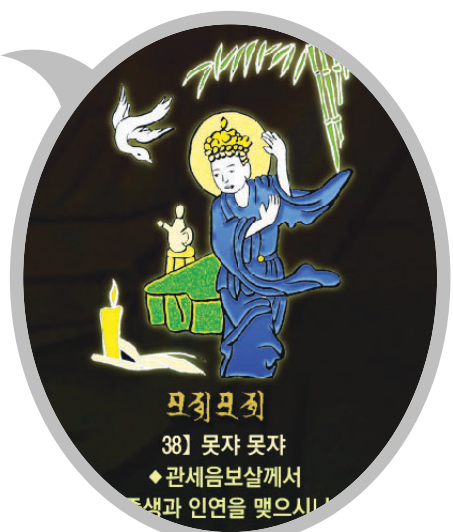
신묘장구 대다라니 족자 중의 '못자못자' 확대사진

범보시용으로 탁월하며 각 가정에 행운과 복을 선사합니다. 10개 이상 구매시 원하시는 문구를 새겨 드립니다.