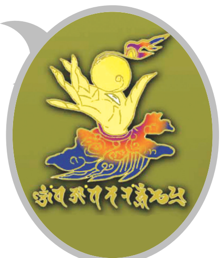
42수진언 족자 중의 '여의수주 진언' 확대사진