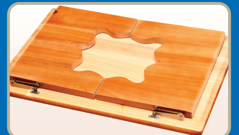
▶ 접은 상태