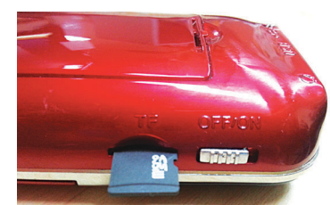
SD카드 삽입 방향

구입처 : 현대불교현불상 (02)2004-8214 입금계좌 : 농협 053-01-269062 (주식회사)현대불교신문사