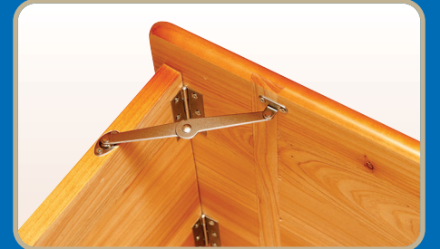
▶ 접이식 고급 경첩