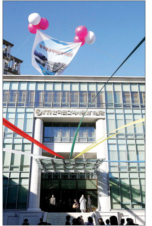
조계종을 상징하는 한국불교역사문화기념관의 모습