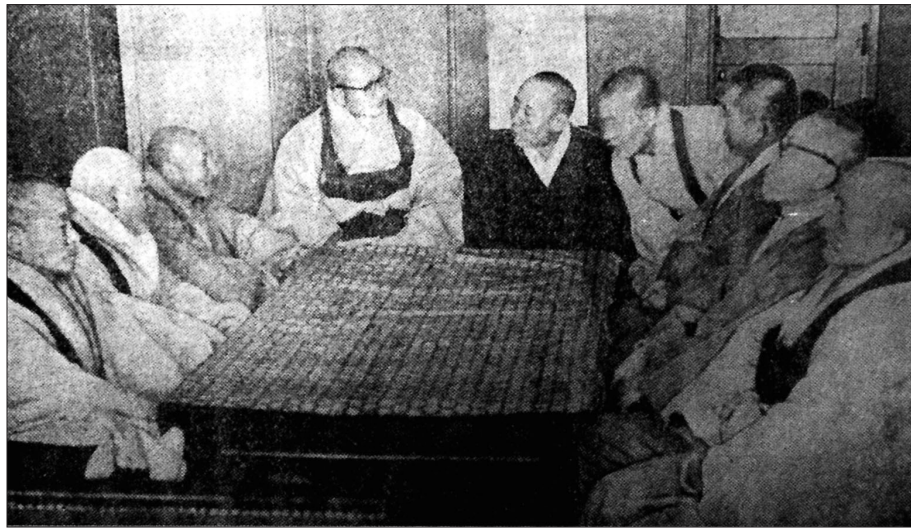
1962년 1월 22일 열린 비구·대처승 양측 대표모임. 불교재건회의 앞서 열린 회의에서 대표들이 환담을 나누고 있다.