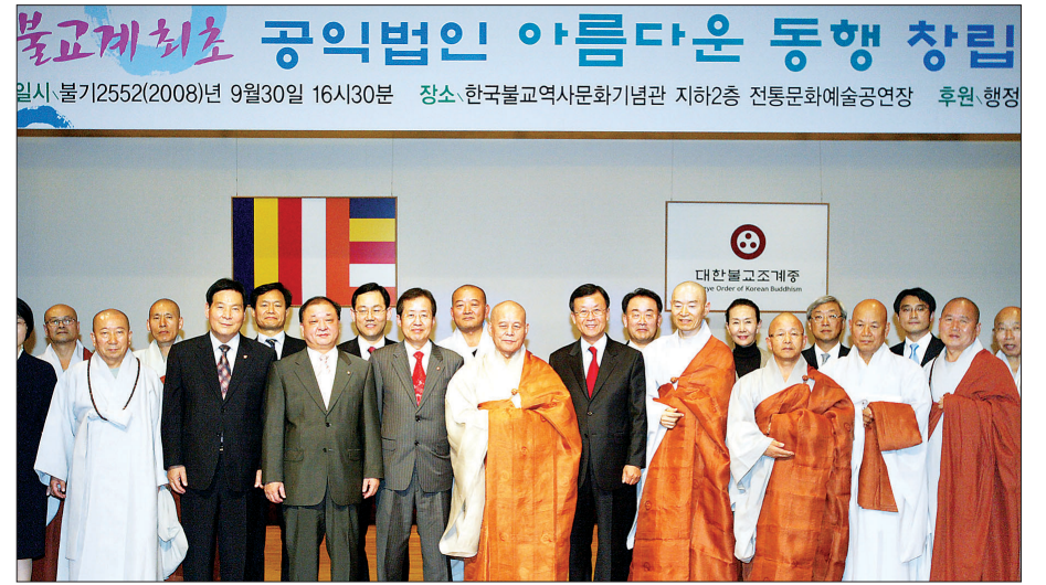
2008년 불교 최초 모교전문기관 아름다운동행 출범식 모습. 절곡의 역사를 넘어 불교는 자비나눔과 사회실천의 종교로 거듭나고 있다.