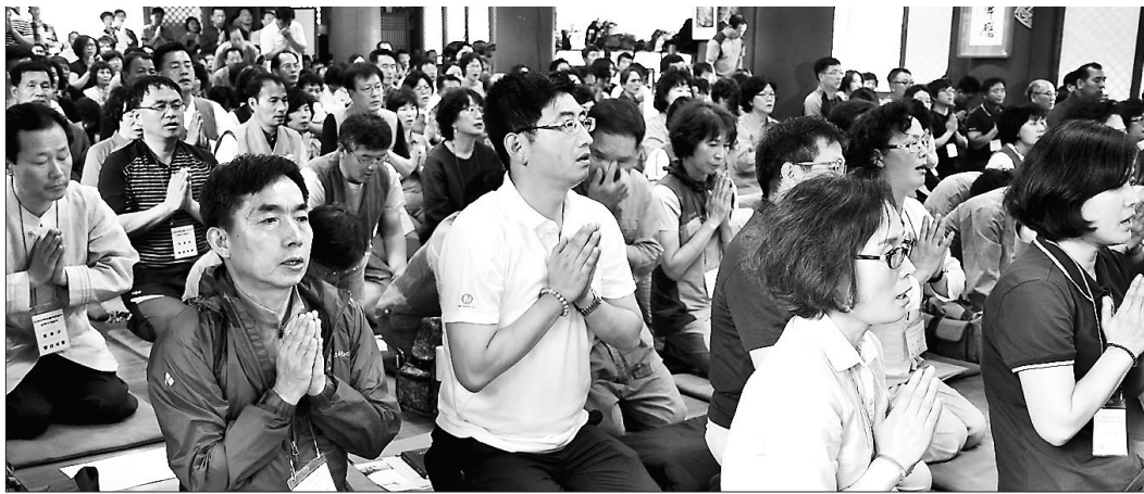
2014년 6월 공불련 회원 및 가족 400여 명이 수덕사에서 열린 합동수계법회에 동참하고 있다.

공불련은 중앙정부와 지방정부 등 각급 행정기관의 공무원 불자들이 모여 부처님의 가르침을 배우는 신행모임이자 교계와 기관을 연결하는 매개체로서 역할을 수행해왔다.