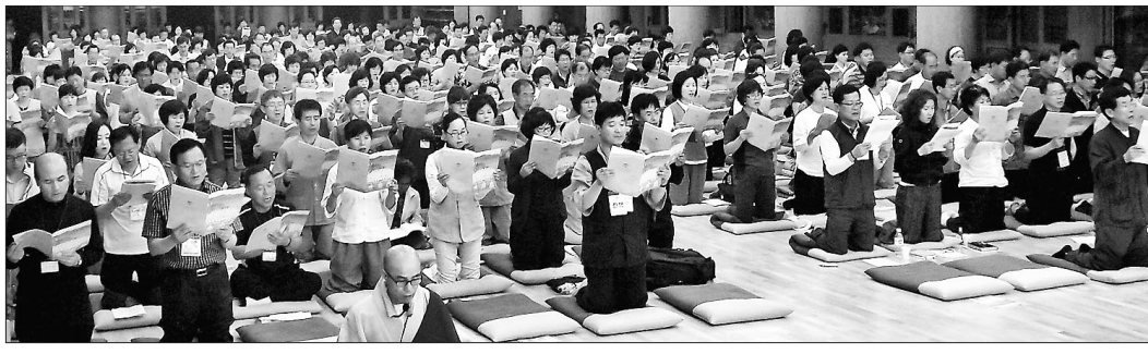
부모은중경을 독송하고 있는 공불련 회원들.

오는 10월 15주년을 맞는 공불련은 2000년 10월 감사원, 국가안전기획부 등 전국 47개 기관의 공무원 불자 700여 명이 오대산 월정사에서 모인 가운데 그 첫발을 내딛었다. "나랏일을 즐겁게, 국민에게"라는 가치를 내건