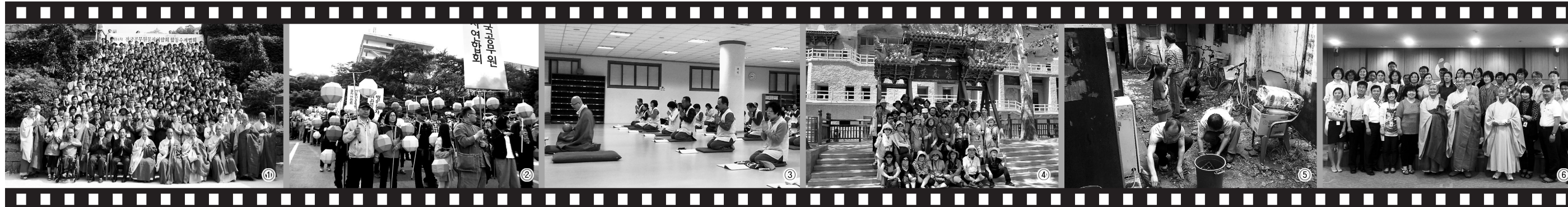
① 2014년 수덕사 합동수계법회 및 성지순례 ② 연동회에 참가하는 공불련 회원들 ③ 2014년 통도사 임원연수 신년법회 ④ 동원학교 공불련 성지순례 ⑤ 2011년 사회봉사의 날 소외이웃을 방문해 청소하는 회원들 ⑥ 정부세종청사불자연합회 회원들

김 회장이 공불련 활동을 시작하고 회장직까지 수락한 것은 신행생활에 어려움이 많은 직장동료들끼리 의지해 부처님처럼 행동하자는 뜻에서다. 그는 공무원불자들에게 "나랏일을 즐겁게, 국민에게 기쁨을" 기치로 공불련이 세워진 만큼 회원들이 조심을 잃지 않고 공직자로서 본분을 제대로 수행하고 있는지 점검하길 바란다"며 "은 몸으로 깨닫는 각자(覺者)가 되기는 어렵더라도 머리와 가슴으로라도 부처님의 귀한 가르침을 익히고 새겨서 책임과 의무를 다하는 참다운 공직자가 될 때, 부처님 제자로서 역할을 다하게 될 것"이라고 말했다. 이나는 기자