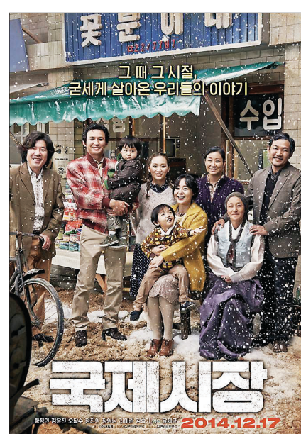
덕수네 가족사진이 담긴 포스터

그 덕수의 삶은 부처님의 전생담을 다룬 자타카의 '원숭이 왕' 이야기를 연상케도 한다. 인간 세상의 왕이 원숭이 사냥을 하러 병사들을 이끌고 숲속으로 쳐들어오자 원숭이 왕은 백성들을 이끌고 도망쳤다. 하지만 그들이 다다른 곳은 막다른 절벽이었다. 그 순간 원숭이 왕은 자기 몸을 다리로 만들어 그 위를 가족 원숭이들이 밟고 도망갈 수 있게 했다. 그렇게 마지막 원숭이가 왕을 밟고 무사