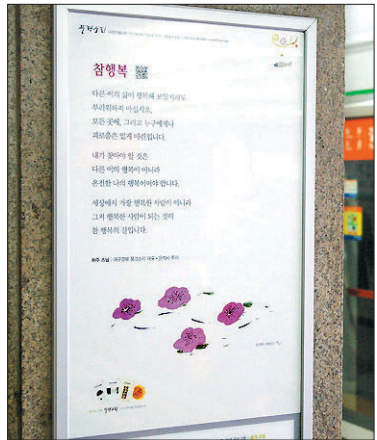
지하철 역사 내에 걸린 풍경소리 게시판. 15년 넘게 전국 2천여 개의 역에서 감동어린 이야기로 사람들에게 지혜를 전해주고 있지만 철거 위기에 놓였다.