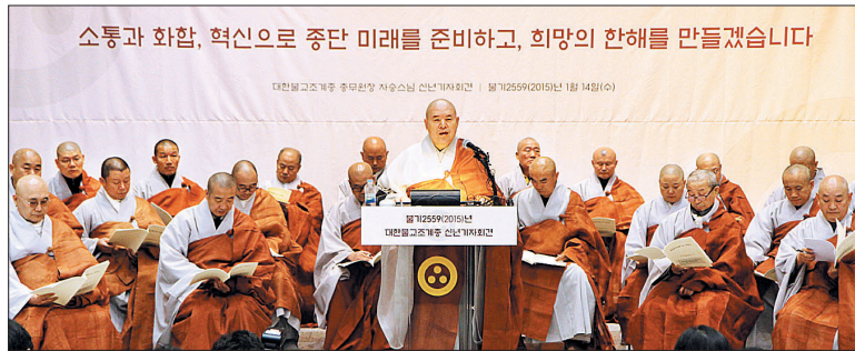
조계종 총무원장 자승 스님은 1월 14일 한국불교역사문화기념관 1층 로비에서 신년 기자회견을 개최했다.

광복 70주년을 맞아 추진하는 '불교통일선언'에 대해서는 공존과 상생, 합심이라는 키워드를 기반으로