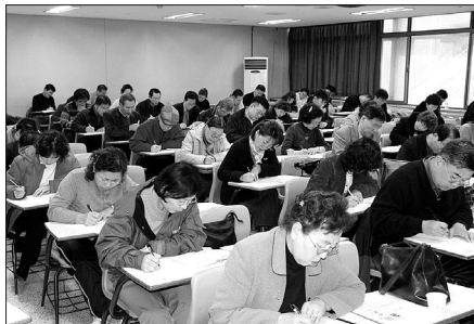
포교사 시험을 보고 있는 응시자들.

조계종 포교원(원장 지원)은 1월 24일 까지 제20회 일반포교사 고시 응시자를 모집한다.