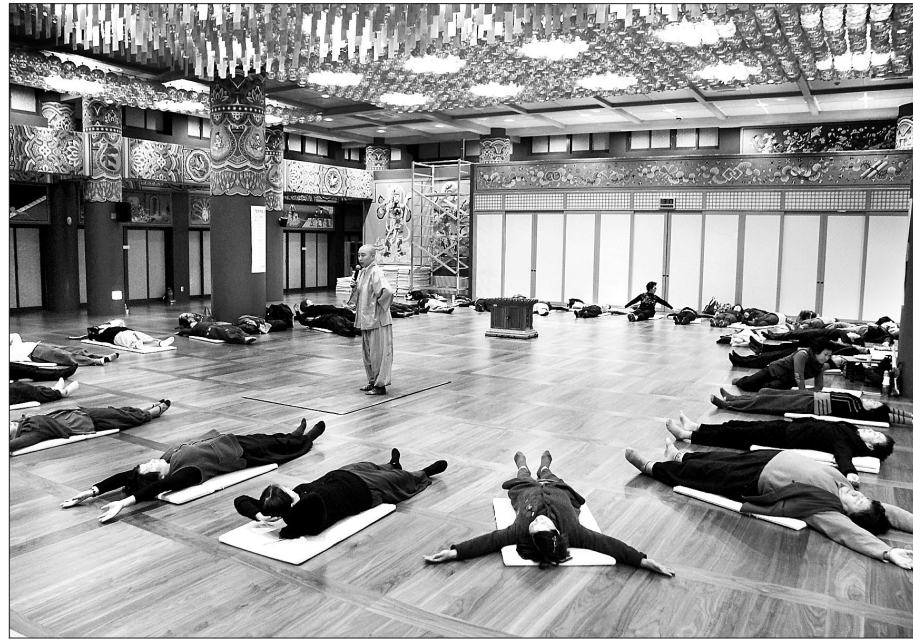
지난 해 성도재일을 기념해 철야명정진 기도 및 명상수행을 진행한 목동 국제선센터는 올해에도 정진을 이어간다.