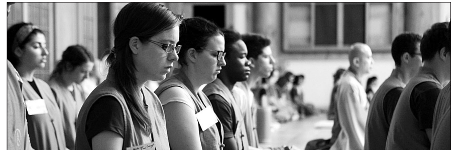
한국불교문화사업단은 2월 8일까지 매주 금요일 한국인과 외국인 학생이 동반하는 템플스테이를 연다.

한국 학생들과 국내에서 유학하는 외국인 유학생들이 함께하는 템플스테이가 열린다.