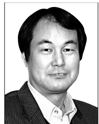
원영상 한일불교문화학회 학회장

2013년 서산 부석사 불상이 절도에 의해 국내에 들어온 이후 한일관계는 악화 일로를 치달았다. 국내의 반일감정과 함께, 일본 내에서도 반한, 혐한 기류가 이어졌는데, 특히 부석사 불상이 있었던 대마도에서는 이러한 기류가 더욱 크게 일었다.