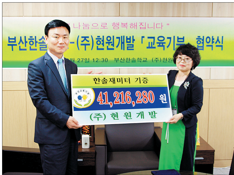
2013년 한솔장애인학교에 교육 기구와 자전거, 장학금 등을 지원했다.