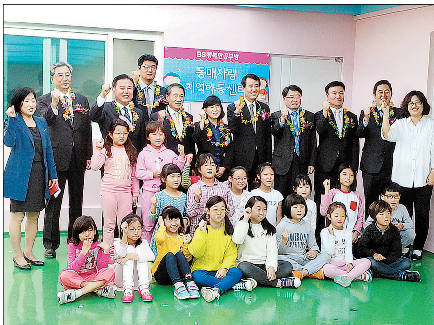
부산은행과 함께 지역 아동들을 위한 공부방 개설도 꾸준히 이어오고 있다.