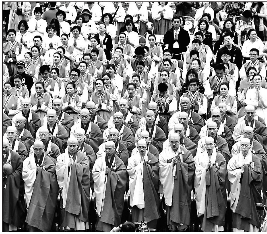
지난해 연등축제 연등법회에서 삼귀의를 하고있는 사부대중들. 삼귀의는 법회의 시작을 알리는 의례이자 부처님 가르침에 의지할 것을 다짐하는 서원이다.

자귀의(自歸依)라는 것 부처님은 사람이 의지할 곳에 대해 다양한 설명을 통해 가르쳤다. 어느 때는 사람은 의(依)를 구하여서는 안된다고 설명했고, 어느 때에는 자기만이 자기의 귀의처