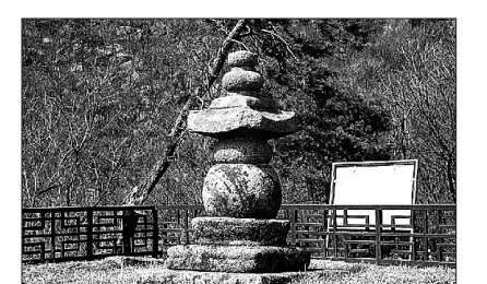
강화 정수사의 함허 스님 부도탑

함허 스님(1376-1432)은 21세까지 성군관 유생(儒生)으로서 경학(經學)을 공부하다 출가, 무학대사 밑에서 수학했다. 법명은 기화, 법호는 득통. 스님은 지공(指空)·나옹(懶翁)·무학(無學)의 3대 법맥을 잇고 있다. 함허 스님은 『현정론(顯正論)』 『유석질의론』을 지어 조선 초 대표적인 호불론자로 꼽히지만, 『금강반야바라밀경 오가해설의』 『금강반야바라밀경론(論)』 『선종영가집과주설의』 등 상당한 저술을 남기고 있는 선지식이다.