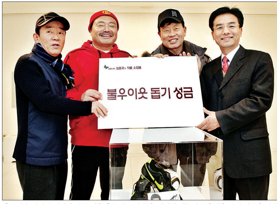
축구선수 박지성 씨에게 선물 받은 축구 슈즈와 공을 경매에 내놓아 블루이웃 돕기 성금을 마련하기도 했다.