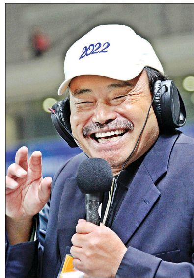
SBS 라디오 진행 장면