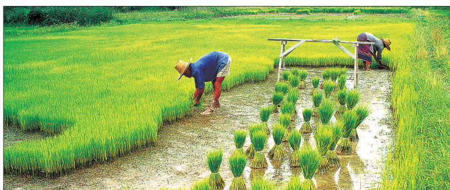
중국 푸젠성 리양산 주민들은 벼에 진언과 같은 불교음악을 들려주어 수확량을 전년대비 15% 증가시켰다. 사진은 벼농사를 짓고 있는 중국인들.