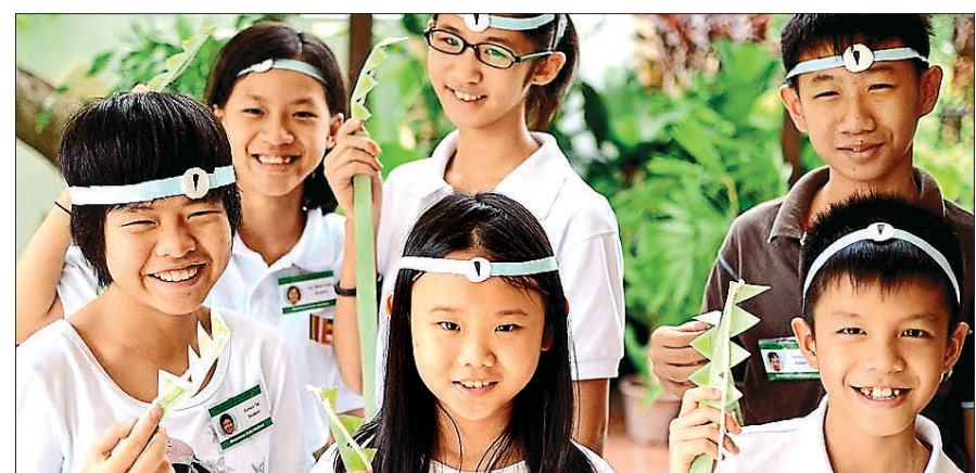
나란다 불교학회의 ‘캠핑 프로그램’에 참여한 아이들이 2박 3일간 함께 할 팀을 결성하고, 해맑게 웃고 있다.

말레이시아 쿠알라룸푸르(Kuala Lumpur) 불교학자들이 비디오 게임 중독에 폭 빠진 아이들의 관심을 돌리기 위해 나섰다.