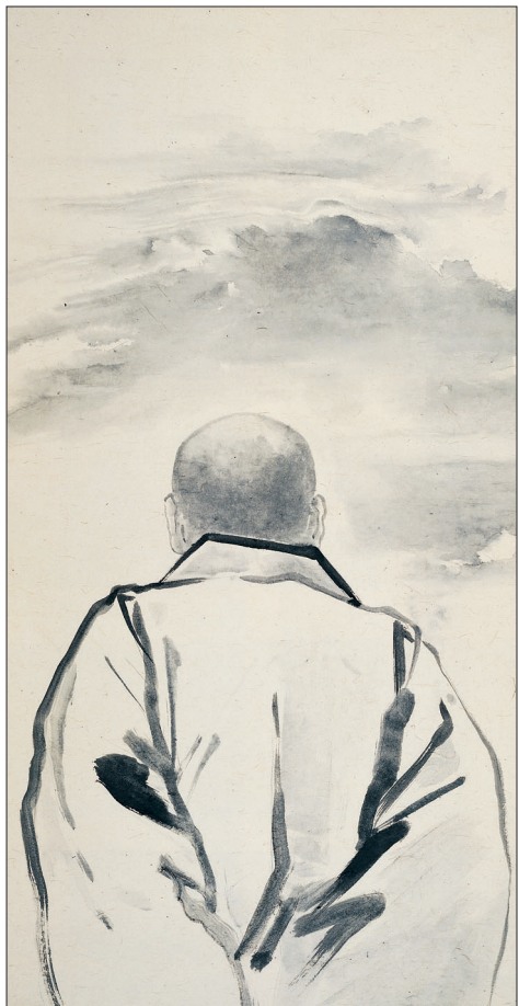
산은 산이요, 물은 물이다 (1994년, 185×95cm, 수묵, 해인사 백련암 소장). 산은 산이요 물은 물이다. 산이 물 위로 간다. 스님은 백련암 앞마당에 머물러 가는 노을 속에 서서 함께 물들었다.