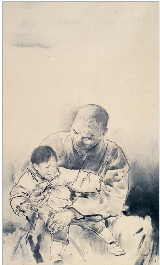
성철스님(1994년, 164×125cm, 수묵, 해인사 백련암 소장). 스님은 아이를 좋아하고, 아이는 스님을 무서워했다. 스님은 아이의 낮가리는 모습조차 사랑스러워했다.

이렇듯 성철 스님의 진영을 그리기에 앞서 많은 공간과 시간을 쏟아 부은 것은 단순한 외형 묘사를 넘어 열과 마음이 스며있는 존상을 구현하기 위함이었다. 이런 노력의 결과 스님의 일상적 삶의 모습을 담은 작품을 30여점을 그렸고 동시에 초상화 작업으로 발전시켜 나갈 수 있었다. 그러면서 성철 스님의 행상에 머무르지 않고 우리시대의 선화적 작업을 확장시켜 새로운 장르로 나아가게 하는 계기도 만들어 주었다. 선화라 명명할 수 있는 수묵화 작업들은 대중들 사이에서도 일정 부분 공감대를 형성했고 여러 미술 평론가들로부터 의미 있는 전사로 평가 받았다.