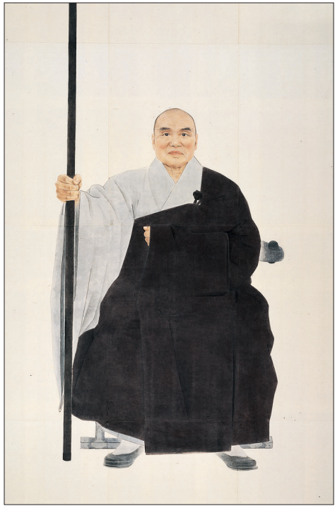
성철스님 진영 (1994년, 253×183cm, 수묵채색, 해인사 백련암 소장). 진영은 표현대상자의 외모는 물론 삶과 정신까지 보여주어야 한다고 생각한다. 깨달음의 세계를 그림으로 표현 한다는 것이 화가의 인생을 걸 만큼 즐거운 명이었다.