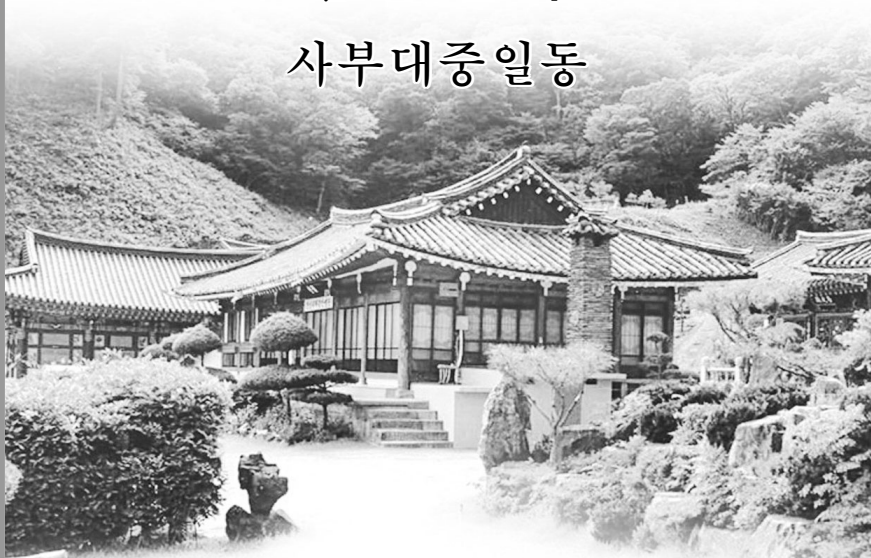
경남 합천군 가야면 치인리 10 (해인사) 전화 055)932-7308