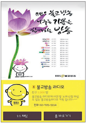
카카오톡 불교방송 라디오 메인 페이지