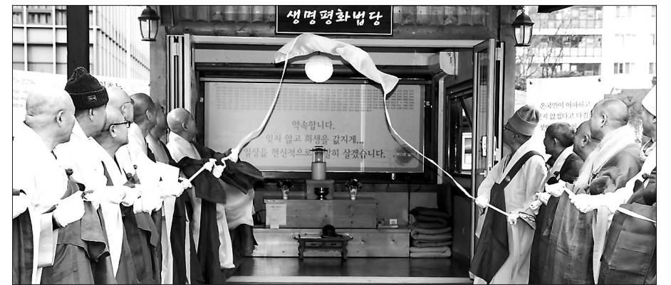
조계종결사추진본부는 구랍 23일 생명평화 1000일 정진 귀향식을 개최했다. 사진은 정진단을 상시 법당으로 전환하는 현판식 모습

이어 도법 스님은 조계종 종정 진제 스님의 ‘붓다로살자’ 친필 휘호를 대웅전 불단에 봉정했으며, 자승 스님과 포교원장 지원 스님은 ‘붓다로살자’ 결사도량 및 결사단체를 선포한 조계사, 국제선센터, 상주사, 금정사, 법륜사, 금선암, 포교사단, 불교레크리에이션협의회 등 총 8곳에 생명평화를 상징하는 연등을 이운했다. 법회가 끝난 뒤 생명평화 1000일 정진