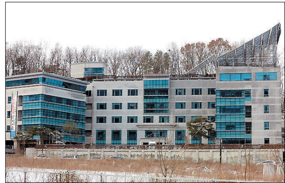
서울 은평구에 위치한 사회복지법인 인덕원 노인요양원

수술을 3번이나 했어요. 장모님의 추천으로 선업을 쌓기 위해 방생을 하며 불교에 대해 새롭게 느끼게 됐습니다. 보시행이 남을 위한 것이 아니라 모두를 위한 것이라고요. 결국 아이도 건강해졌죠. 나중에 한마음선원 대행 스님을 찾아가니 스님께서 아이 옆에 화엄신장이 지키고 있다고 하시더군요.”