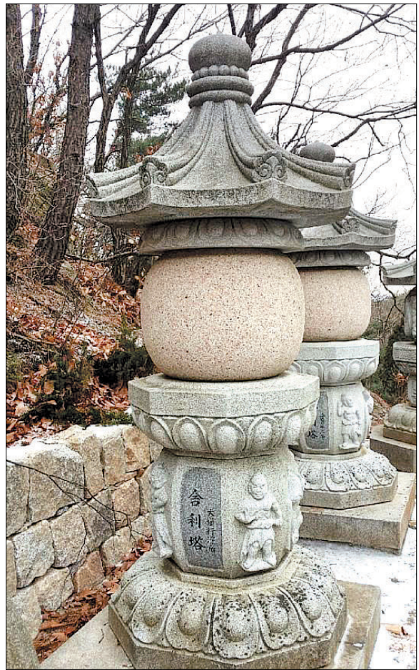
삼천사에 자리한 대도행 보살의 사리탑. 성운 스님은 대도행 보살로 인해 많은 사람들이 발심하게 됐다고 말했다.