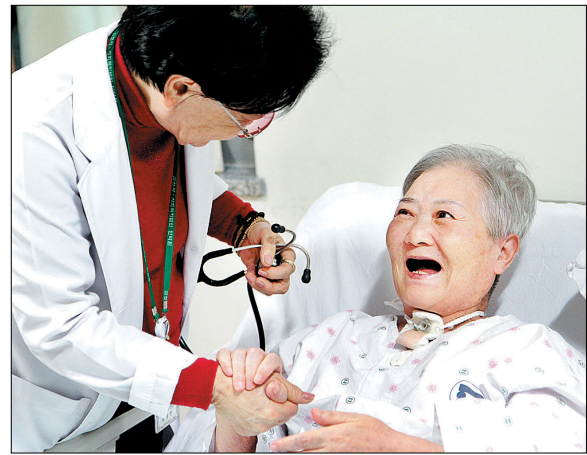
목수술을 해 말을 할 수 없는 어르신이 조원장을 보며 활짝 웃고 있다.