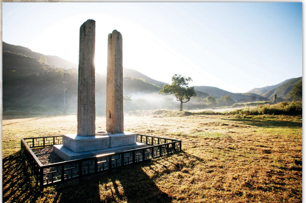
제 1회 대한민국 전통문화사진공모전 수상작