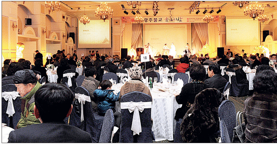
광주불교연합회와 빛고을나눔나무는 공동으로 구립 19일 광주 신양파크호텔에서 '2014 광주불교 송년의 밤' 행사를 개최했다.

대상을 받은 차이나공은 올해 광주전남 지역 불교행사와 군법당, 불교계 무료 식당 등에서 가족들이 참여해 자장면 2만 그릇을 무상으로 보시하며 봉사활동을 해왔다.