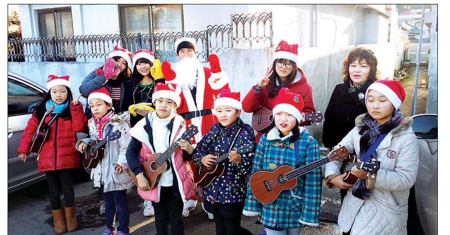
완도 신흥사가 '사랑의 몰래 산타' 활동에 동참해 완도 지역의 소외 이웃을 도왔다.

대한불교조계종은 대한민국 전통문화의 아름다움을 나누고자 [전통문화사진 디지털 아카이브] 구축하고 있습니다.