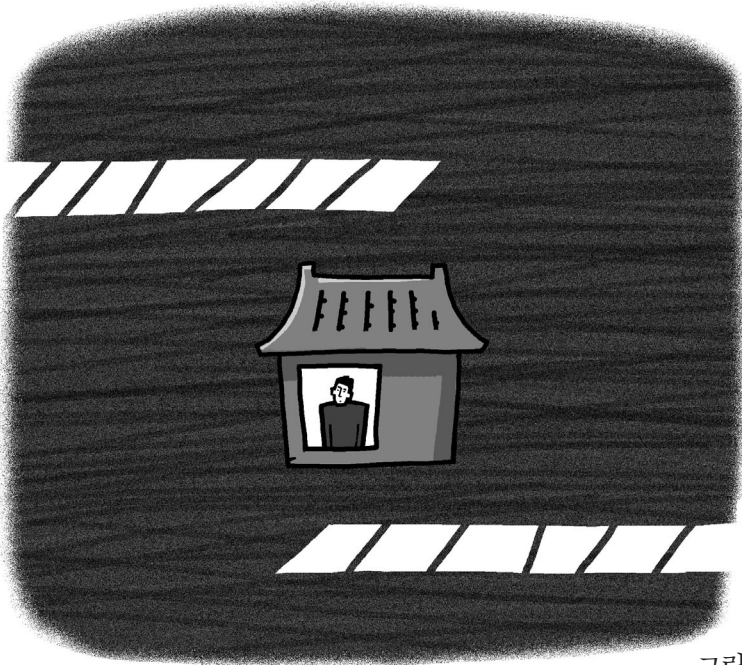
그림 · 최주현

여기 처음 오면 해입니다. 어머니가 혼자 딸을 하나 데리고 사는 집이 있었는데 그 어머니가 상당히 안고하셨습다. 아버지 없는 대신으로 엄마 뒀어 뒀어 다 하면서 딸을 귀중하게 사랑하고 있었습다. 그런데 그 딸이 참 예쁘장하고 잘생겼는데 대학을 다니던 도중에 어느 사람을 사랑했습다. 그런데 어머니가 알고