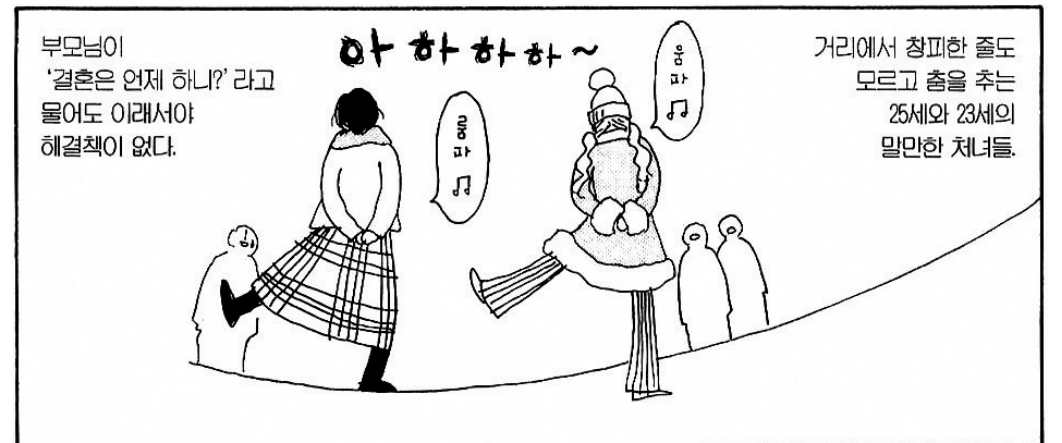
니노미야 토모코의 <음주가무연구소>의 한 장면. 예절을 중요시 한다고 생각되는 일본에도 이런 유쾌한 주정뱅이들이 있다. 작품에 등장하는 이야기는 모두 주당인 작가의 자전적 일화다.

하게 만들고 우리의 근본 마음을 무명(無明)으로 덮어 지혜를 발현시키지 못하게 만들어 버린다"면서 "이와 같은 측면에서 본다면 술을 마시는 그 자체가 지도 본질적인 죄가 될 수 있으나 주 그 자체가 죄라고 하기보다는 술에 취하게 되면 살생, 투도, 음행, 망어의 성취를 유발한다는 속성이 더 강하기 때문에 일반적으로 차죄로 규정하고 있는 것"이라고 설하기도 했다. 다만 차계는 재가자에게만 해당되는 것이 아니라 출가자에게는 해당되는 것이 아니다. 그럼에도 연말이 되면 스님들의 음주 범계사건이 끊이지 않는다. 지난해에는 한 곳에 모여 밤새 음주 파티를 열어 문제가 됐고 올해에는 조계종 총무원장 상좌 스님 2명이 음주 운전으로 적발돼 망신을 사기도 했다. 이것이 대한민국 불교의 부끄러운 민낯이라면 민낯일 수 있겠다.