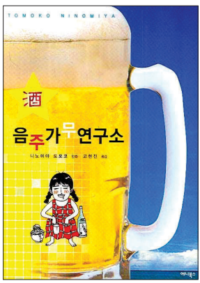
니노미야 토모코의 <음주가무연구소> 표지

연말연시는 술을 먹기 참 좋은 시절이다. 회사, 동문 등 연일 이어지는 송년모임에서 우리는 술과 전정을 벌인다. 실제 술자리를 좋아하는 한국 사람은 1인당 연평균 소주 84병을 마시는 것으로 조사됐다.