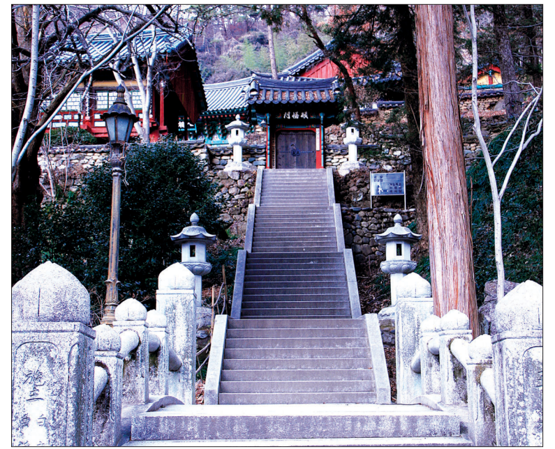
쌍계사 돈오문 오르는 계단

구름 사이 숨었구나 빼어난 봉우리 그윽한 사람 상대하여 마음도 깨끗하네. 샘물은 하얗게 뿜어 오솔길 적시고 햇살은 아지랑이 쪼여 석담에 걸고나. 차가운 계에 불씨 찾아 향을 피우고 고요한 밤에 염주 잡으니 종도 울라네. 백 년을 좌선하면 피안에 이르나니 반딧불이는 일침 계승 길게 울조리나.