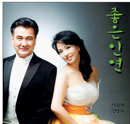
2013년 5월 발매한 ‘좋은 인연’ 음반 표지