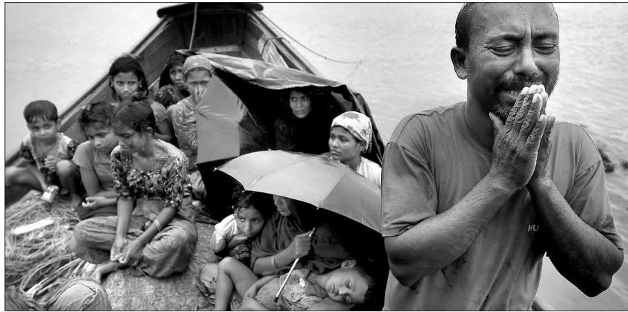
이슬람교도에 대한 탄압을 자행하는 불교국가 미얀마에서 피난온 이슬람교도 난민가족(사진 왼쪽). 미얀마의 빈 라덴으로 불리는 아신 위라투 스님.

마하 호사인 아지즈 교수에 따르면, 티베트 불교 지도자 달라이 라마는 "미얀마와