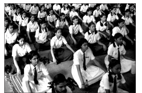
인도 마하라슈트라주 2500만명 초중고생의 스트레스 완화를 위한 대규모 명상 프로젝트가 시작됐다.

수식관은 콧구멍 입구에 의식을 집중하고 자연스러운 들숨과 날숨을 관찰하면서 호흡이 어떻게 마음의 상태와 관련돼 있는지를 깨닫도록 하는 것이다. 인도 주정부 교육부는 효과를 극대화하기 위해 모든 학생이 의무적으로 이 프로