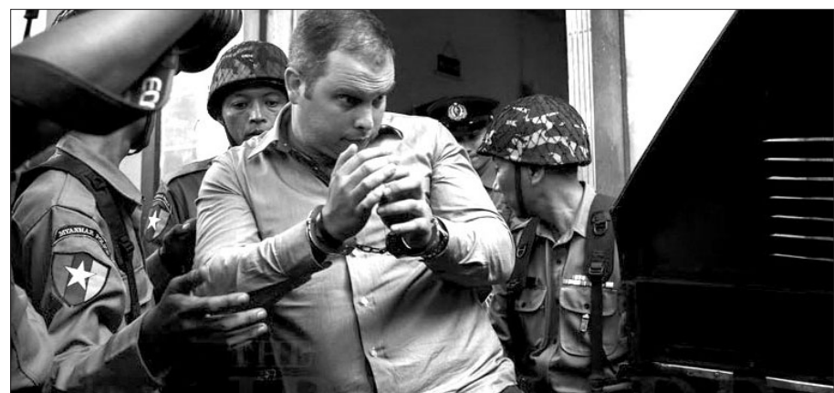
미얀마 랭군에서 유흥업에 종사하는 뉴질랜드인이 '종교 모욕죄'로 미얀마 법정에 서게 됐다.