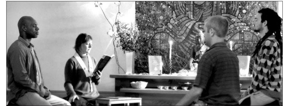
지금까지 불교가 서양으로 전래된 것은 1899년 캘리포니아 라는 게 정설이었지만 이번에 새롭게 발견한 기록물에서는 이보다 10년 앞서 찰스 파운드스가 아일랜드에 불교를 전한 것으로 밝혀졌다. 사진은 아일랜드 더블린에 있는 한 불교사원.

"불교를 서쪽에 최초로 전래한 사람은 아일랜드인 찰스 파운드스(Charles Pounds)이며, 그 시기는 1889년"이라는 주장이 새롭게 제기됐다.