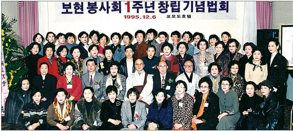
1995년 보현봉사회 창립 1주년 기념법회