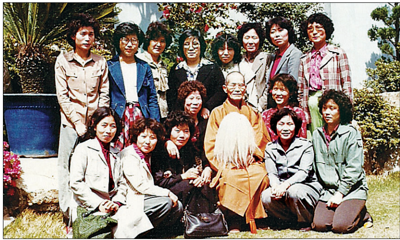
1997년 가을 연꽃모임 창립당시 고암 스님과 함께