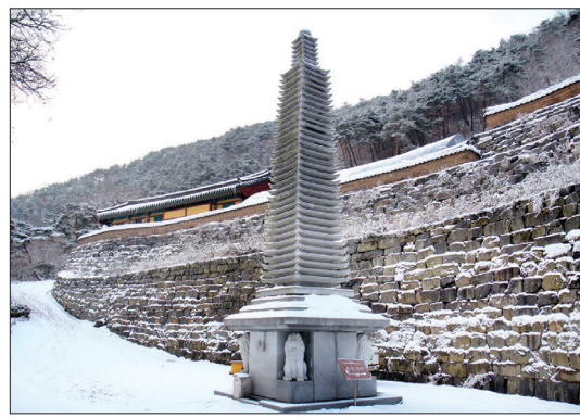
33층 높이의 사리탑이 우뚝 솟아 있다.