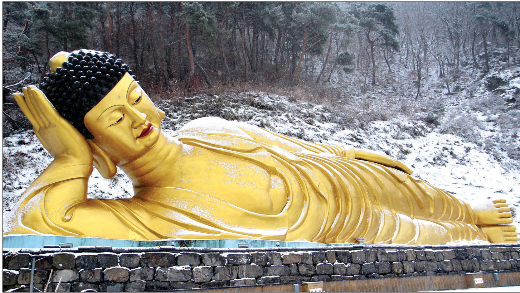
길이 30m, 높이 7m, 손가락길이 3.5m로 큰 규모를 자랑하는 와불. 특히 발바닥에는 1만6천여 문자가 새겨져 있다.

사람들 발길이 많은 와불의 발 쪽으로 가보니 문이 하나 있다. 열고 들어가 보니 또 '감탄사'가 흘러 나온다. 놀랍다. 누워있는 와불의 몸속에 바로 예불을 드리는 법당이 있는 것이다. 열반상 법당은 순금으로