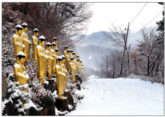
절 입구 한쪽 면에는 금불이 200여 개 나란히 세워져 있다.

"앞으로 천년고찰 미암사를 기도전문도량으로 꾸밀 것입니다. 매년 넘쳐나는 기도객들로 요사채 등 공간이 부족함에 이를 점차 보완해 나갈 것입니다. 그리고 언제든 누구나 찾아와서 편안히 자신의 원력을 점검하고 발원할 수 있도록 최선의 노력을 다하겠습니다."