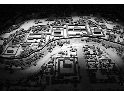
경주 월성 디지털 조감도 역 주민 등과 적극적으로 소통하고 관광자원화 해 신라 천년 고도 경주의 역사성과 정체성을 높여 나간다는 계획이다. 노덕현 기자

문화재청은 경주 월성 발굴조사가 다른 유적 발굴의 모범이 될 수 있도록 학계, 지