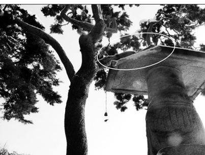
사진 원 표시 부분이 파손된 것부분 한 보수 대책을 마련할 방침이다. 한편, '부여 대조사 석조 미륵보살 입상'은 고려시대인 12세기에 제작된 높이 10m의 대형 석조상이다. 노덕현 기자

이번 폭설로 인해 가지가 부러진 소나무는 지난 1979년 8월 7일부터 부여군이 보호수로 지정, 관리하고 있다. 문화재청과 국립문화재연구소는 긴급 현장점검을 시행하고, 파손된 부위에 대해 안전조치를 취했다. 또 현지 조사 결과에 따라 적정