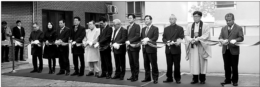
12월 8일 선재누리 개관식 당일 관계자들이 건물 앞에서 테이프 커팅식을 하고 있다.

서울시 최초 부자가족복지시설 '선재누리'가 12월 8일 서울 성동구에 개관했다. 불교계 최초의 부자보호시설로 진각종유지재단(이사장 회경)이 운영 및 관리한다.