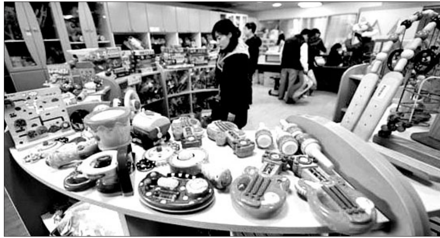
장난감도서관은 아이들의 발달을 돕기 위한 장난감을 저렴한 가격으로 대출할 수 있는 도서관이다.

지난달 11월 종로노인종합복지관(관장 정관)에 도서관이 생겼다. 한옥으로 지어진 어르신 전용, '별별별 도서관'이다. 노