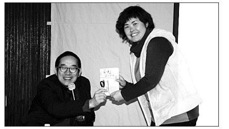
고정욱 작가(사진 좌)와 시민이 교양강좌의 책을 가운데 들고 웃음짓고 있다

이날 고정욱 씨는 '더불어 사는 세상을 위하여'라는 주제로 자신의 인생이야기를 소재로 장애인의 삶과 그에 대한 사회적