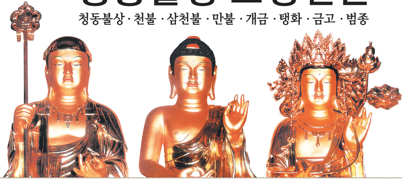
지장 보살 아미타불 관세음보살

청동불상 · 천불 · 삼천불 · 만불 · 개금 · 탕화 · 금고 · 범종