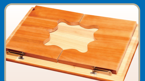
▶ 접은 상태