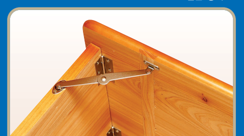
▶ 접이식 고급 경첩