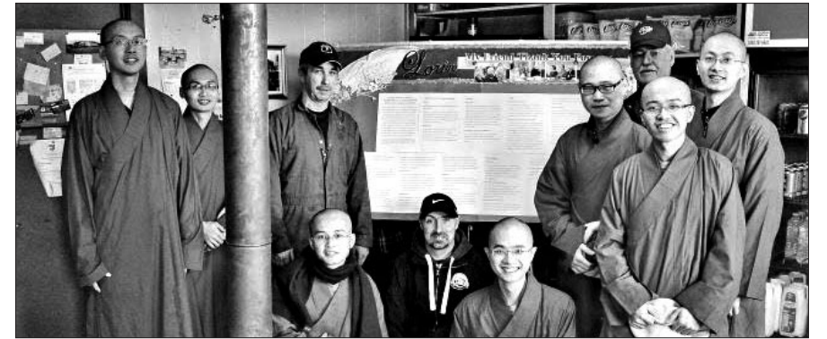
대만 스님들이 캐나다에서 포교하는데 도움을 준 현지인에게 공덕문을 전달했다.

캐나다 프린스에드워드아일랜드(Prince Edward Island, 이하 P.E.I)의 대만계 불교공동체가 지난달 세상을 달린 한 캐나다인의 추모식을 봉행하고, 그의 선행을 알리고 있어 화제다.