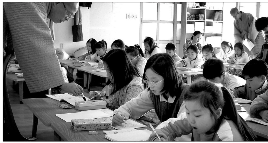
산사에서 한문을 배우고 스님과 참선하는 한문학당을 비롯해, 스키캠프와 수련회는 지덕체를 함양하기에 더할 나위 없는 프로그램이다. 한 사찰에서 한문학당에 참여하고 있는 어린이들.

파라미타... 스키캠프 개최 용주사... 다양한 명상체험 쌍계사·미항사·부석사는 한문학당으로 인성·예절교육 실시